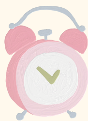
Présence de moments communs pour la planification