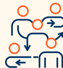
Clarté des rôles et des responsabilités