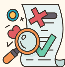
Formation continue et accompagnement du personnel