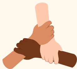
Soutien de la direction