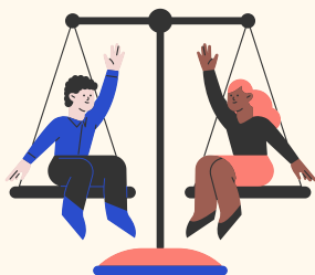
Égalité entre enseignants