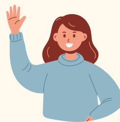
Implantation sur une base volontaire