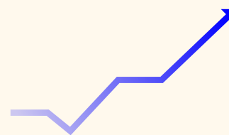
Intensité de sa mise en place