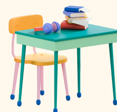
Composition de la classe (élèves)