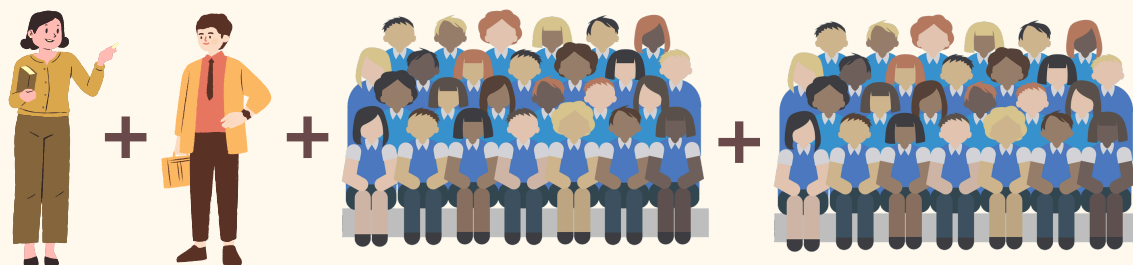
2 enseignants pour 2 classes